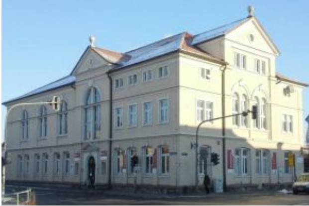
Pirnaer Landstraße / Ecke Bahnhofstr.

Nach den Winterferien starten wir am neuen Standort unserer Musik- und Tanzschule.